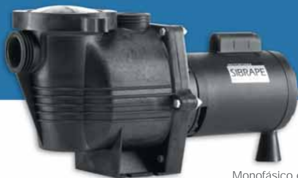
Monofásico e trifásico.

motor 3/4 cv · 1,0 cv · 1,5 cv · 2,0 cv · 3,0 cv