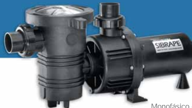
Monofásico e trifásico.

motor 1/4 cv · 1/3 cv · 1/2 cv · 3/4 cv · 1,0 cv